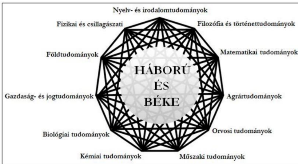
1. ábra: a „háború és béke” témakör multidiszciplináris jellege.